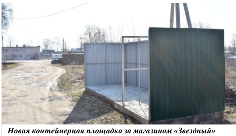
Новая контейнерная площадка за магазином «Звездный»