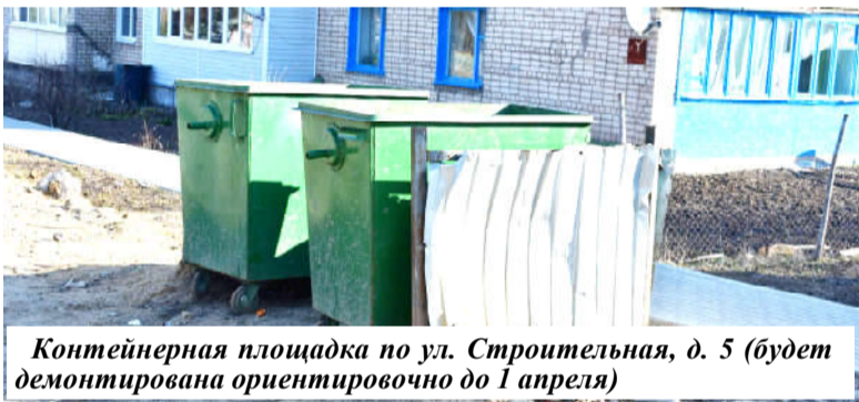
Контейнерная площадка по ул. Строительная, д. 5 (будет демонтирована ориентировочно до 1 апреля)

С 2020 года вывоз бытовых отходов в Бабынинском районе обеспечивает ООО «Спецавтохозяйство г. Обнинск». Качество выполняемых работ, своевременный график вывоза, значительно улучшили санитарное состояние на наших улицах. Для проведения работ по вывозу накопившихся отходов применяется более современная техника. Конструкция ранее смонтированных контейнерных площадок на улицах